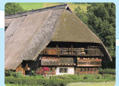
Vogtsbauernhof/ Gutach im Kinzigtal