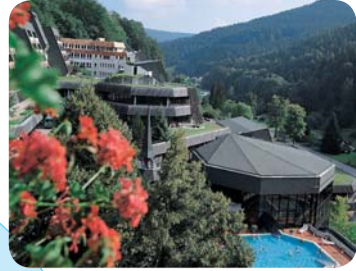
Schwarzwaldklinik Bad Rippoldsau