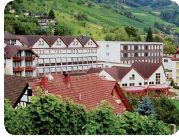
Kliniken Dr. Wagner GmbH Sasbachwalden