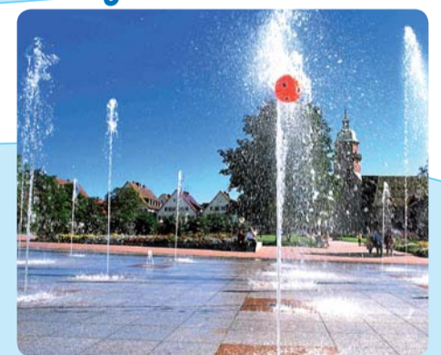
Marktplatz / Freudenstadt