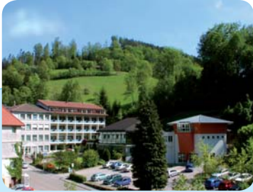
Gesundheitszentrum St. Anna Bad Peterstal-Griesbach