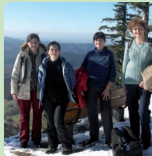
St. Anna Winterwanderung mit herrlichen Ausblicken auf's Tal